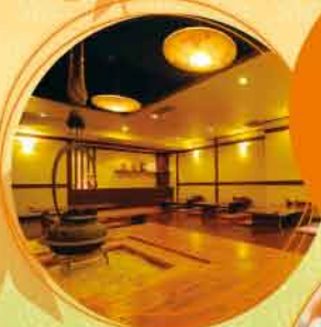
〈あおい食堂 いろいろの間〉