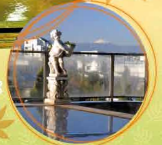
〈混浴展望露天風呂〉